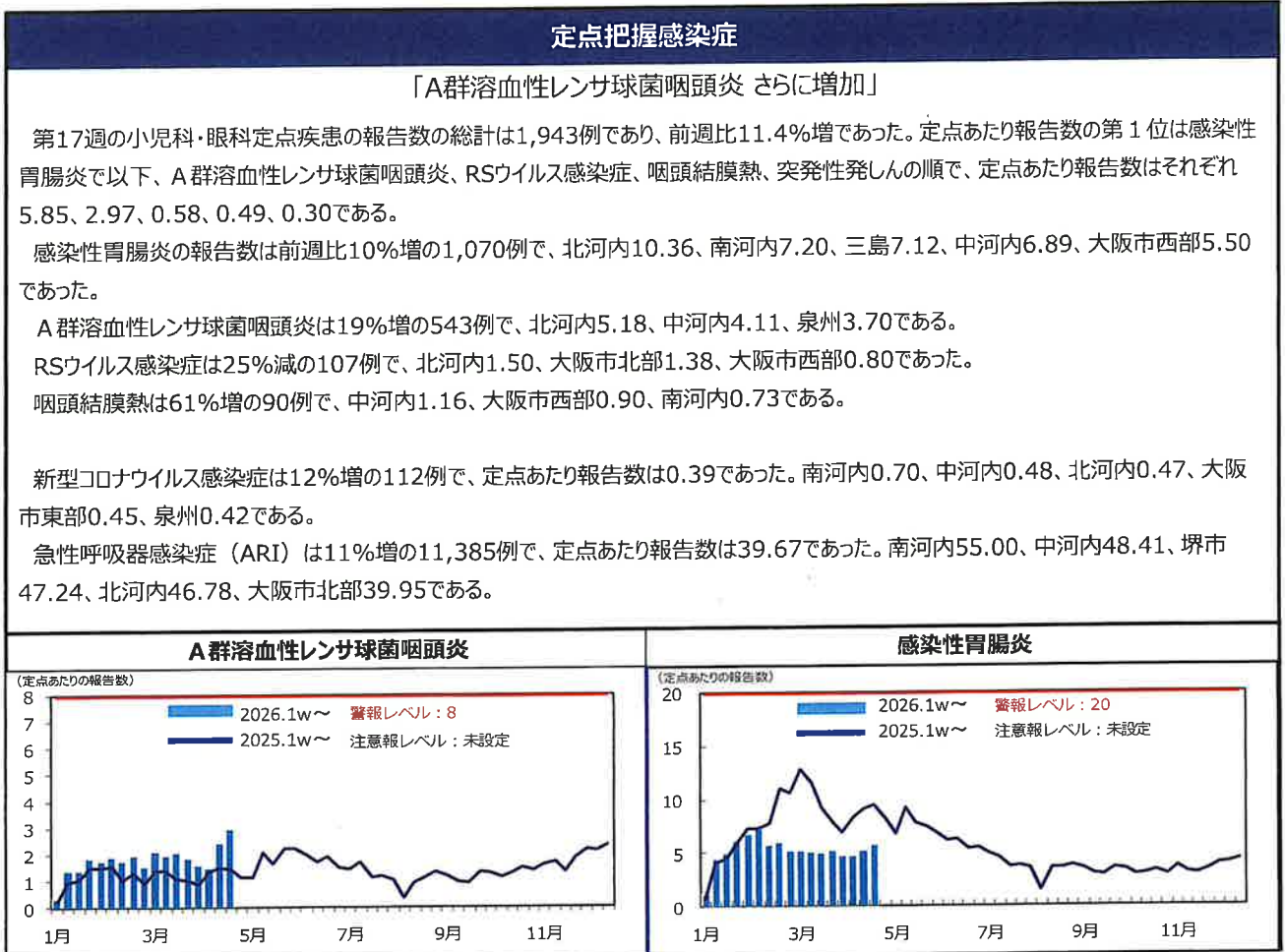
表1. 大阪府小児科・眼科定点把握感染症の動向（2026年 第17週4月20日～4月26日）